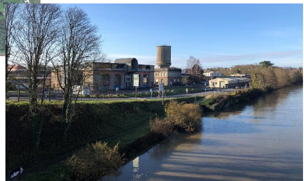
Friche Henkel/Leroy vue de la Seine.